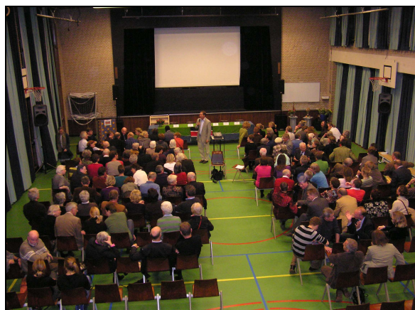
Impressie van het symposium