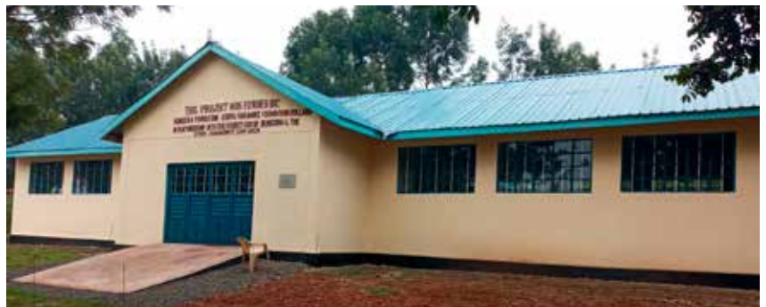
Officiële opening van het project op Kitayi Primary School