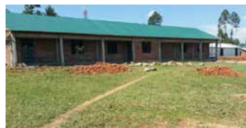
Op de middelbare school van Makunga worden een paar practicumlokalen gebouwd

Kimilili ligt aan de voet van Mount Elgon, de op een na hoogste berg van Kenia. De heuvels eromheen zijn vruchtbare grond. Eerder grendse dit gebied aan dat van de witte kolonisten met hun grote boerderijen. De gewassen – vooral maïs, uien en aardappelen – worden vernaakt in Kimilili en daarna vervoerd naar Eldoret en Nairobi. Het is een levendig stadje met twintigduizend inwoners, een hoofdstraat, één hotel, twee supermarkten, een bank en vooral een grote markt. Kimilili is ook de uitvalsbasis van Tatwa Mwachi, een drijvende kracht achter ontwikkeling van onderop in de wijde omgeving, een breng van verandering die zich met name inzet voor beter onderwijs.