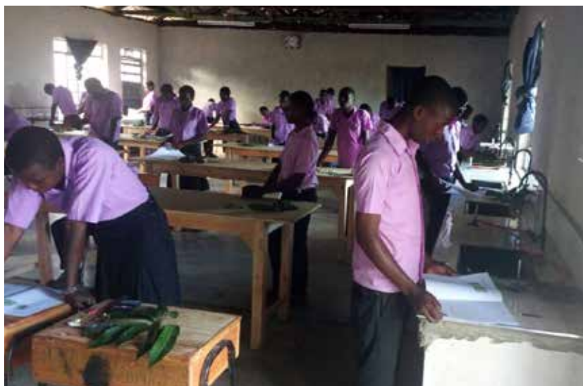
Leerlingen doen al examens in de nieuwe lokalen op Makunga Sec. School