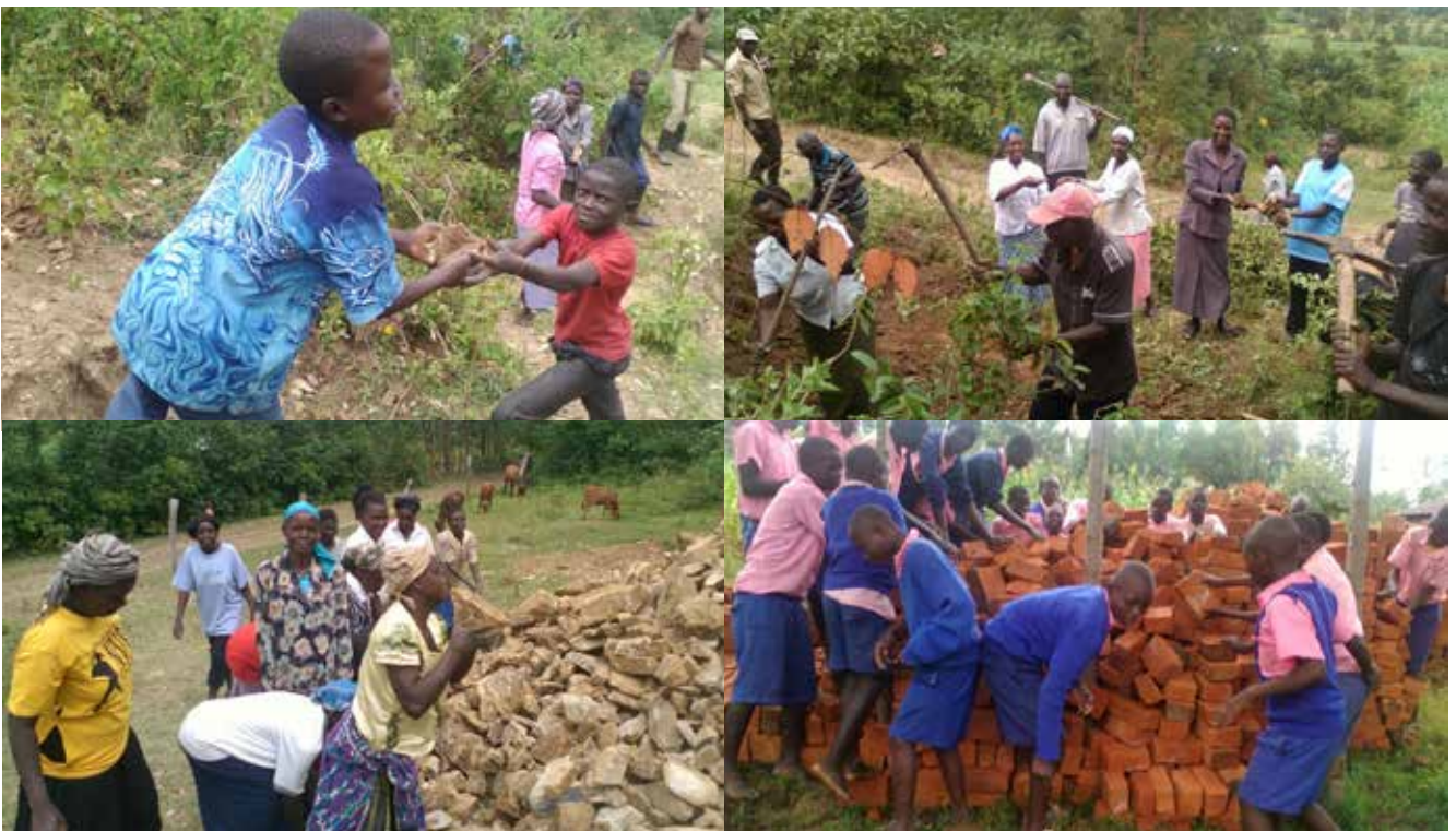
Ouders en leerlingen in actie voor de bouw van 3 kleuterklassen op Kitayi Primary school in Kimilili

Op dit moment heeft de stichting met tegenslagen te maken. De reden is de huidige politieke situatie in Kenia, met name in Nairobi en het westen van het land, waar ook wij onze projecten uitvoeren.