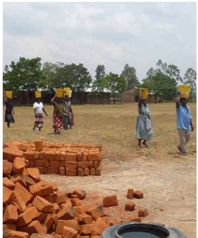
Indangalasia Primary School: de moeders halen water voor het project

De twee slaapzalen voor de weeskinderen worden afgemaakt zonder ICFEM als partner. Dit is zo besloten door de bisschop van de Anglican Church of Kenya, de sponsor van de school. Een extra bijdrage is wel noodzakelijk. Harambee, samen met de overheid en gemeenschap helpen mee om het project af te maken.