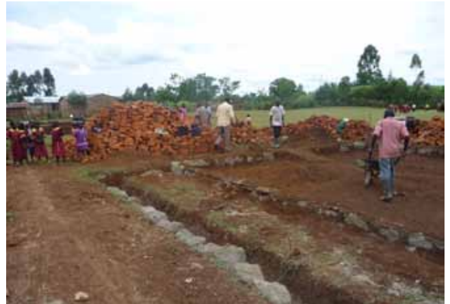
Kibunde Primary school: het leggen van de fundering

Toekomstig project voor de bouw van sanitaire voorzieningen op deze middelbare meisjesschool.