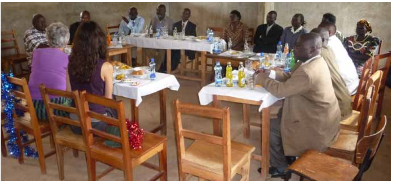
Vergadering met het schoolbestuur over het project