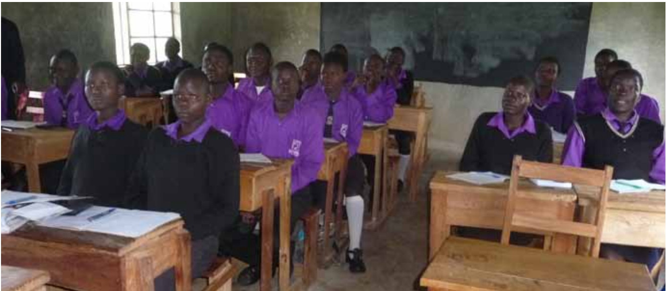
Leerlingen in hun klas

Dit is de eerste school die met behulp van de nieuwe werkwijze gerealiseerd gaat worden.