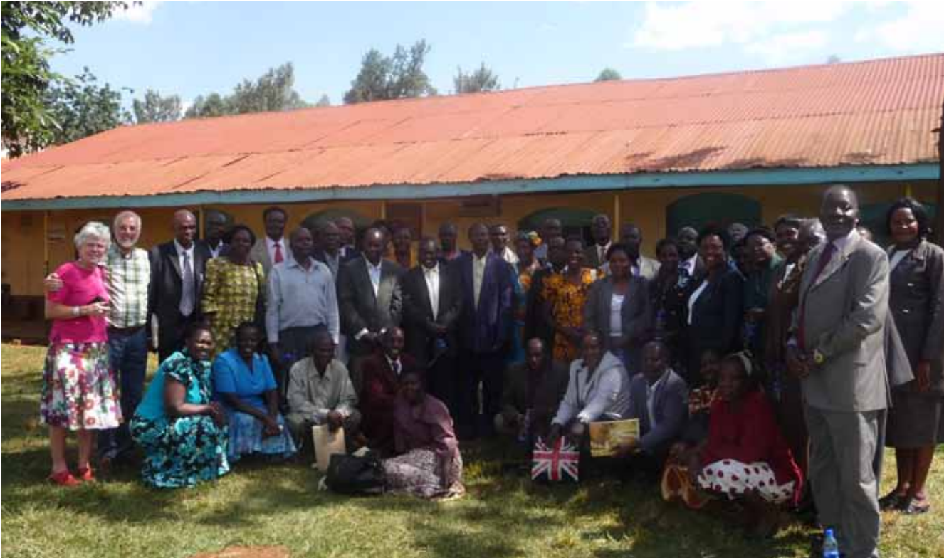
Alle hoofden van de lagere scholen na de training

Ongeveer drie jaar geleden is de stichting begonnen met het organiseren van cursussen en trainingen. Deze blijken een groot succes te zijn, gezien de grote belangstelling van de betrokkenen.