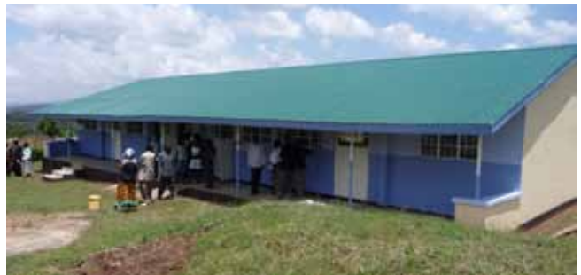
Het nieuwe gebouw met 2 grote technische klaslokalen

Twee weken later is een motorblok dat door een lid van Rotaryclub Breda –West werd gedoneerd, aangekomen op de school. Dit is een geweldige hulp om de kinderen die automonteur willen worden te helpen. Binnenkort zal Tools to Work gereedschappen naar de school sturen.