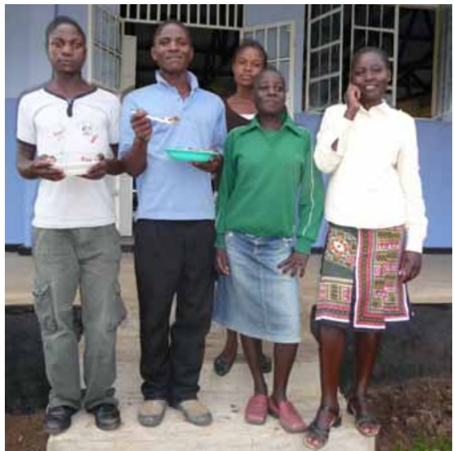
Blijde leerlingen voor hun nieuwe school