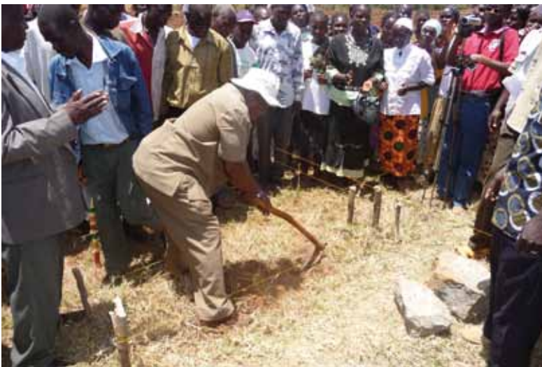
Een dorpsoudste steekt de eerste schop in de grond

In onze nieuwsbrief van december 2010 hebben we informatie gegeven over ons grootste project in de afgelopen 10 jaar: de bouw van de complete nieuwe IcFEM/Hafoland lagere school met 16 klaslokalen.