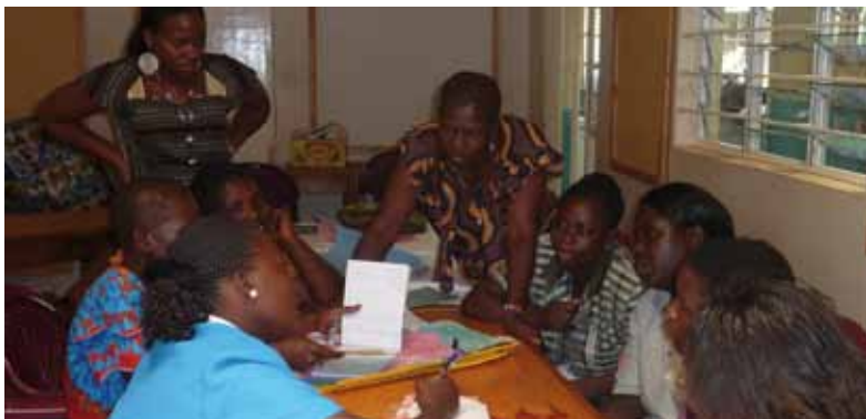
Samen denken en praten over hoe het beter kan

Voor kleuteronderwijzeressen hebben twee ECDE (Early Childhood development Education) trainingen plaats gevonden. De eerste begin maart en de tweede begin oktober 2011.