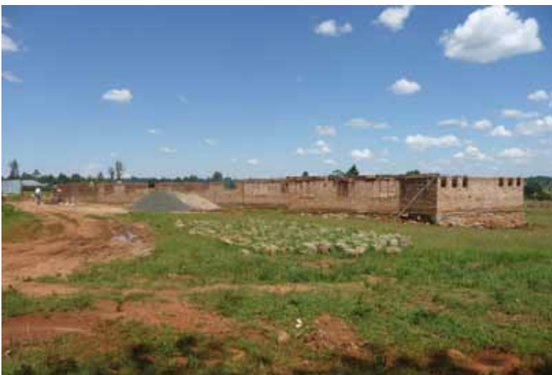
De contouren worden al zichtbaar

De eerste schop ging in de grond op 4 maart 2011. Het was een groot feest voor iedereen. Ter gelegenheid ervan voerden de vrouwen van de gemeenschap een toneelstukje op voor de aanwezigen over het belang van onderwijs voor hun kinderen. Toen we in augustus terug kwamen was het bijzonder om in het kale land zo'n groots bouwwerk te zien verrijzen. De contouren zijn al duidelijk zichtbaar. De school wordt in een U-vorm gebouwd. Aan de lange zijden komen de klaslokalen, op de verbinding hiervan de kantoren. Er werd druk gewerkt. In Kenia verwacht men dat de bouw op een redelijke termijn zal zijn afgerond, wellicht februari 2012. We hopen dat hun wens in vervulling gaat.