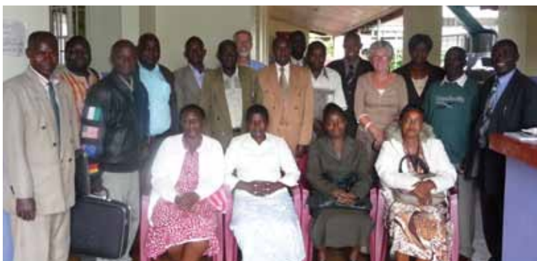
En natuurlijk de groepsfoto na afloop!

Op 14 en 15 oktober jl werd een training voor schoolhoofden van lagere scholen gegeven door Tatwa Mwachi en Jowi Otieno.