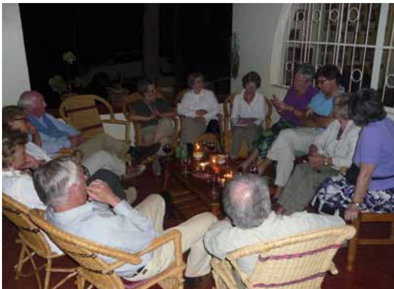
Uitgebreide discussie op de veranda