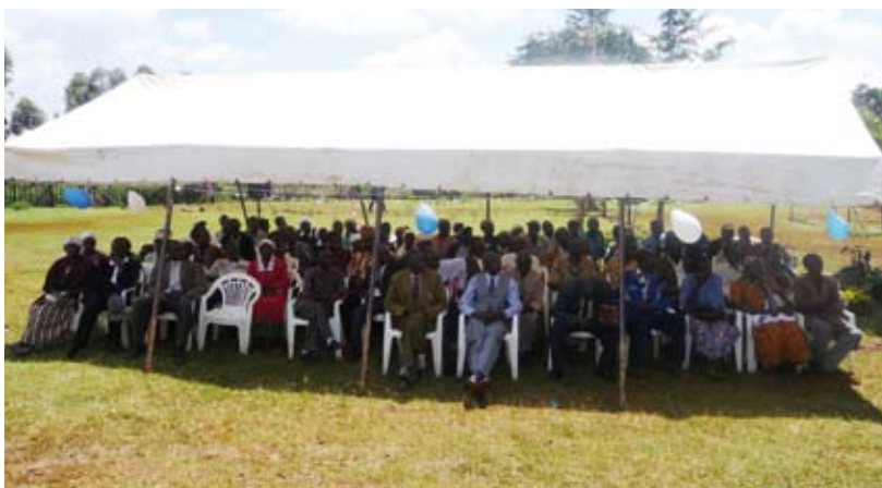
De ouders tijdens de overhandiging in Kamasielo