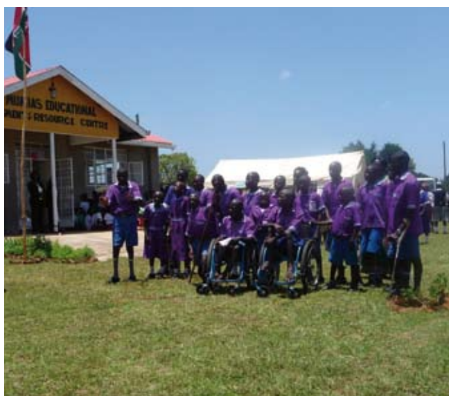
Voordracht van gehandicapten kinderen bij opening.

Dit centrum voor gehandicapte kinderen in Mumias waar kinderen zo veel mogelijk voorbereid worden op het reguliere onderwijs, werd in oktober officieel geopend. De realisatie ervan is in fases tot stand gekomen. Het resultaat is schitterend. Van heinde en ver komen mensen er heen om het centrum te bezoeken. Het blijkt nu dat door de betere faciliteiten er veel meer kinderen geholpen kunnen worden. Het was een vreugdevolle dag, er waren 300 mensen aanwezig en er was veel entertainment door de kinderen: dove kinderen die dansten, rolstoelers, kinderen die lieten zien dat ze veel mobieler geworden waren. Het Keniaanse team dat er werkt is enorm enthousiast. We zullen hen blijven volgen.