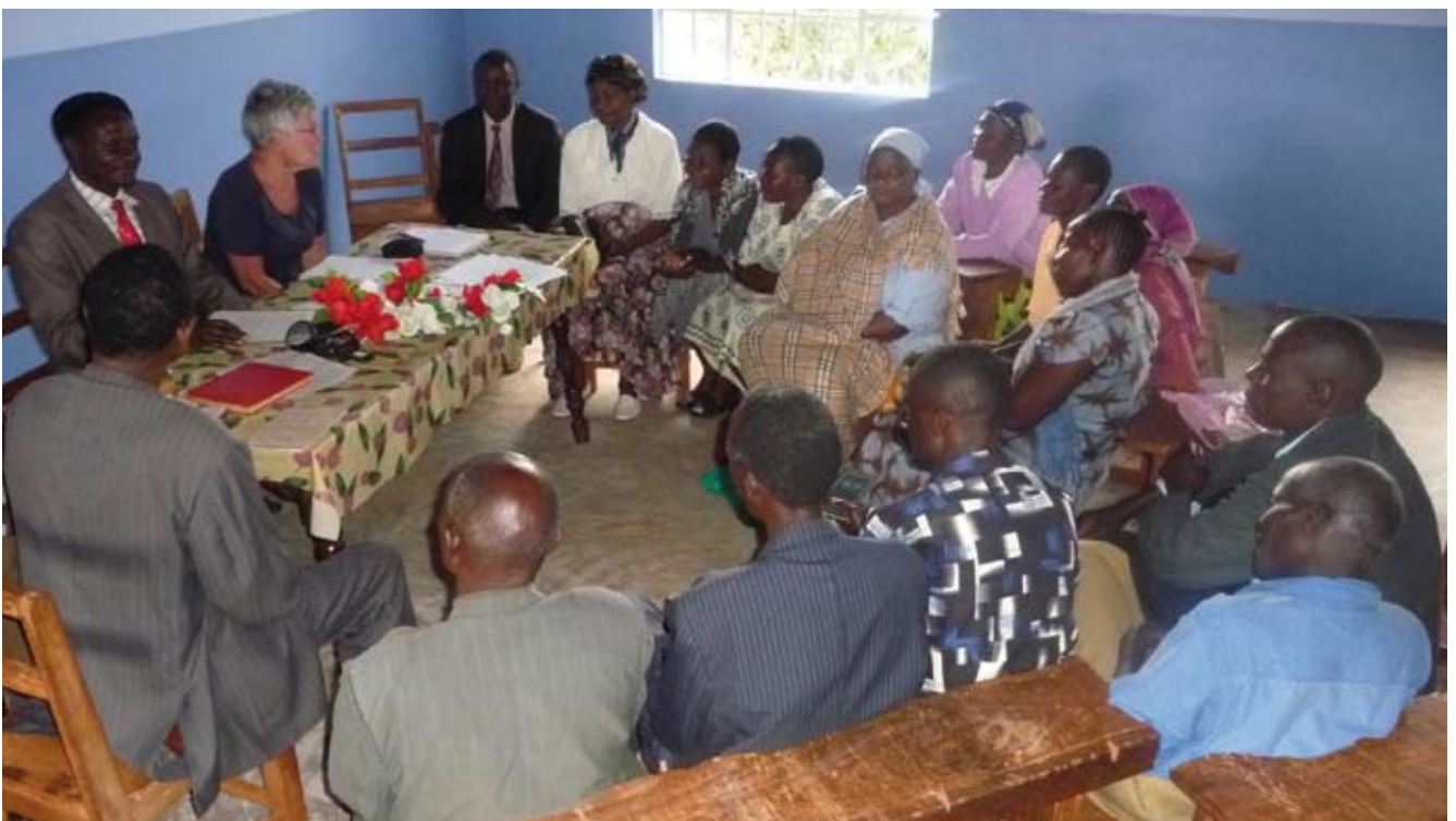
Overleg met de ouders op Kamusinga Primary School over een nieuw project

In deze nieuwsbrief hebben we weer veel te vertellen: goed nieuws, maar ook over moeilijke tijden die we meemaken. Tijdens het laatste verblijf in Kenia zijn 5 projecten afgerond en overhandigd met een groot feest en veel blijheid.