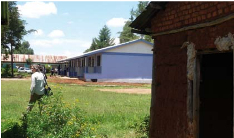
Oud en nieuw in Sosio

Zoals eerder in onze nieuwsbrieven te lezen was, is het met technisch onderwijs in de omgeving van Kimilili bedroevend gesteld. Er zijn nauwelijks faciliteiten, geen gereedschappen. Leerkrachten zijn nauwelijks opgeleid en krijgen van de overheid een vergoeding van € 20 per maand. De gemeenschap ziet nauwelijks de waarde in van deze vorm van onderwijs. Redenen waardoor het zelfbeeld van de leraren en leerlingen zeer laag is. Al lange tijd hebben we samen met onze partner ICFEM gekeken of hier iets aan te doen viel. We bezochten 6 technische scholen en overlegden met hen, de overheid en andere betrokkenen. Hulp zou alleen in een totaal pakket zin hebben, niet alleen nieuwe gebouwen. Dit heeft geresulteerd in de volgende aanpak.