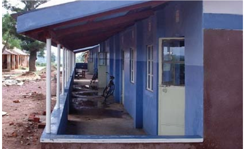
De veranda van de nieuwe lokalen

Hierbij worden alle betrokkenen uitgenodigd en zijn er veel ouders aanwezig. De festiviteiten duren vaak een hele dag en gaan gepaard met veel zang, dans of toneel door de leerlingen, toespraken door hoogwaardigheidsbekleders, de officiële opening d.m.v. het doorknippen van een lint en het overhandigen van de sleutel, een bezichtiging van de nieuwe lokalen, het planten van bomen en een uitgebreide maaltijd tot slot. Ook wij maken als guest of honour deel uit van het feest, o.a. door een toespraak, het planten van een boom en het verrichten van de openingshandeling, meestal samen met enkele leerlingen. Met deze feestelijke overhandiging hebben de scholen een welkome, kwalitatief goede aanvulling gekregen op hun merendeels schamele behuizing. We zijn blij, samen met de ouders en de leerlingen,