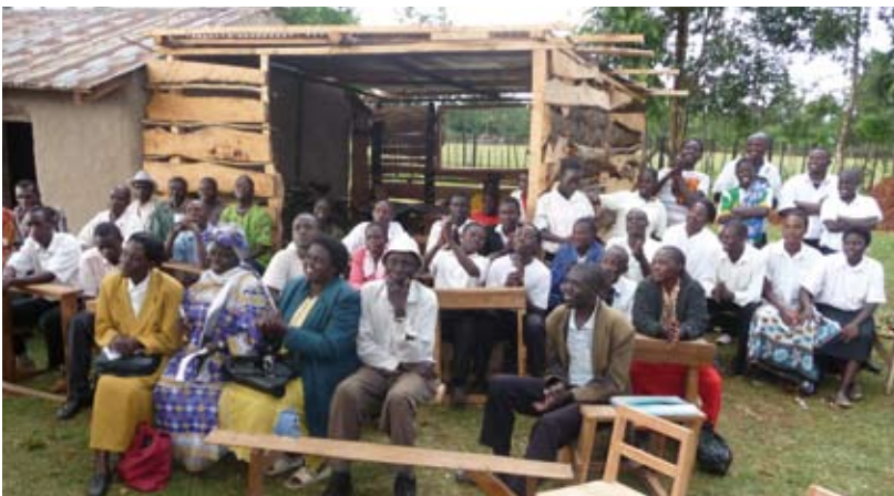
Ouders luisteren tijdens een vergadering op school

De rol die de ouders hebben bij goed onderwijs door de projecten komt soms verrassend goed uit de verf.