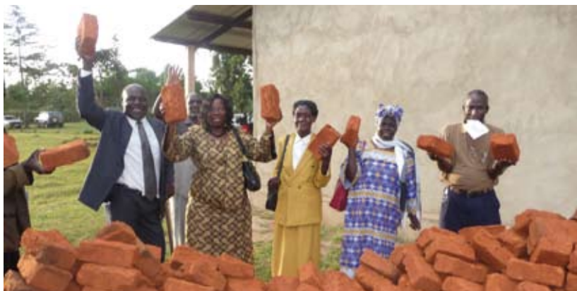
De ouders zijn er klaar voor!

Ter informatie zetten we deze projecten even voor u op een rij: