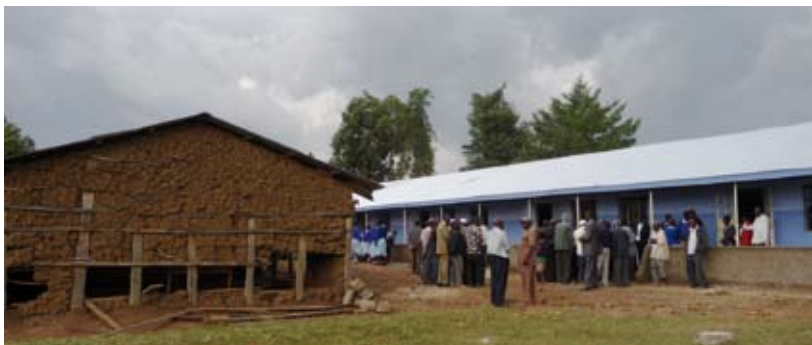
Oud en nieuw

Het zijn 4 lagere scholen in Naitiri, een afgelegen streek op ruim een half uur rijden van Kimilili: