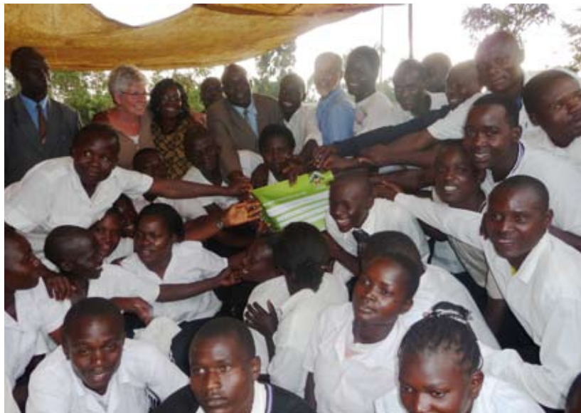
De overhandiging van de cheque

Op dit moment wordt er in de omgeving van Kimilili en Mumias weer hard gewerkt aan 7 nieuwe projecten.