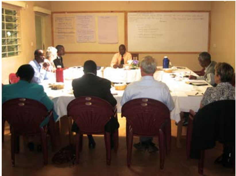
De vergadering over kwaliteit

Niet alleen goede gebouwen dragen bij aan kwaliteitsverbetering van het onderwijs. Veel andere aspecten spelen ook een rol, zoals bijv. een goed schoolhoofd, bekwame leerkrachten, een toegepast lesprogramma, goede leermiddelen etc.