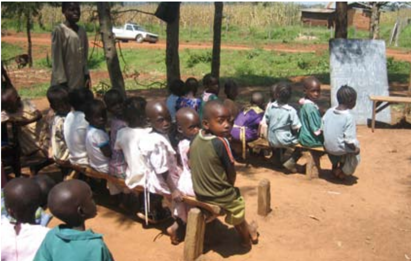
De kleuters krijgen les onder de boom

Graag houden wij u op de hoogte van de ontwikkelingen rond de bouw van een nieuwe school in Naitiri. Dit is voor Stichting Harambee een bijzonder project omdat het de eerste keer is dat we een geheel nieuwe school gaan bouwen.