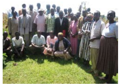
Het voltallige schoolcomité bij de plaats van de nieuwe school