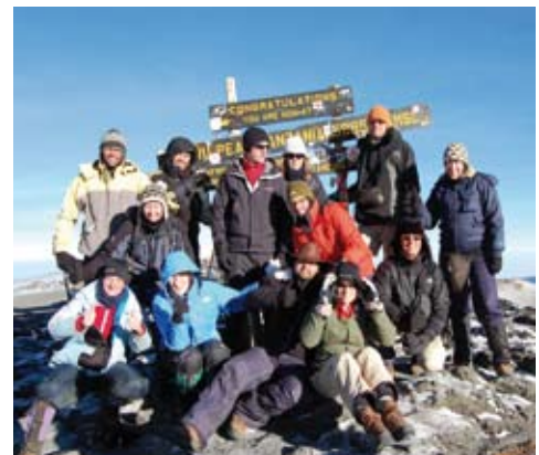
Op de top!

In maart 2009 beklommen 14 mensen van Stichting Kili4Kids, een initiatief van fysiotherapiepraktijk Spine-Care, het dak van Afrika. Het was een zware expeditie van 7 dagen lang naar de bijna 6000 m. hoge top van de Kilimanjaro. Kili4Kids heeft tot doel het financieel ondersteunen van organisaties die werkzaam zijn in ontwikkelingslanden door het organiseren van sponsoractiviteiten en evenementen met een sportieve achtergrond. Bedrijven en particulieren hebben in totaal € 22.000 gedoneerd. De opbrengst wordt gelijk verdeeld tussen Stichting Sibusiso t.b.v. gehandicapte kinderen in Tanzania en onze stichting. Wij willen alle deelnemers hartelijk bedanken voor deze schitterende prestatie van formaat! De bijdrage zal worden besteed aan de nieuw te bouwen school in Naitiri. Wij zullen er zorg voor dragen dat het geld goed zal worden besteed.