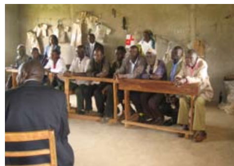
De ouders luisteren scherp

Intussen zoeken wij nog verder naar uitbreiding van ons Comité van Aanbeveling.