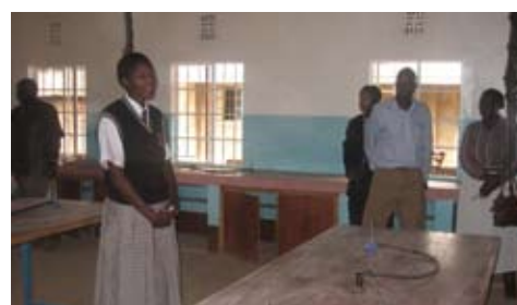
Dankwoord van een leerling