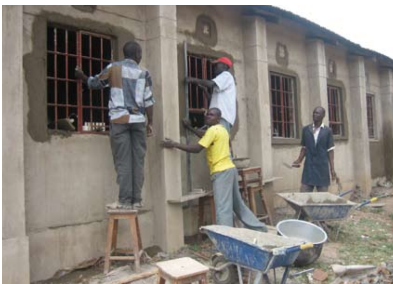
De laatste hand aan het werk

Bij Mukuyuni Secondary School stond op dinsdagmiddag 10 maart jl. een feestelijke middag op het programma. Het project voor de school, de renovatie van 2 lokalen voor schei- en natuurkunde was nagenoeg afgerond en deze konden officieel worden geopend.