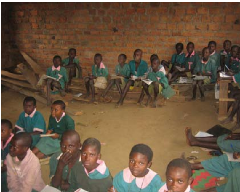
Geen schoolbanken: dan maar op de grond

De 4 projecten betreffen renovatie of nieuwbouw van klaslokalen op iedere school. Hierover hebt u kunnen lezen in onze vorige nieuwsbrief.