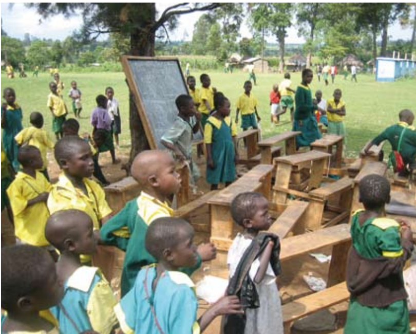
Bij gebrek aan klaslokalen: les onder de boom

Ten oosten van Kimilili ligt op een half uurtje rijden een aantal lagere scholen dicht bij elkaar in het Tongaren gebied. In samenwerking met onze partner IcFEM lopen hier momenteel 4 projecten. De scholen zijn zonder uitzondering overbevolkt: ze hebben allemaal tussen de 1300 en 1500 leerlingen. 100 Kinderen of meer in een lemen klaslokaal zonder boeken of schoolbanken is eerder regel dan uitzondering.