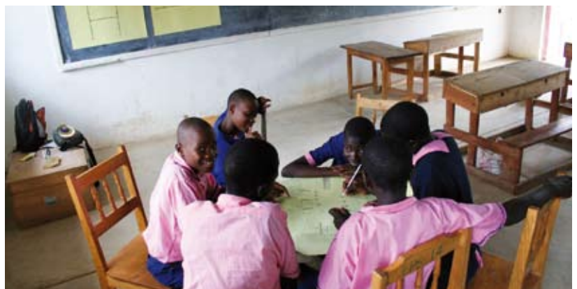
Leerlingen aan het werk met de opdracht