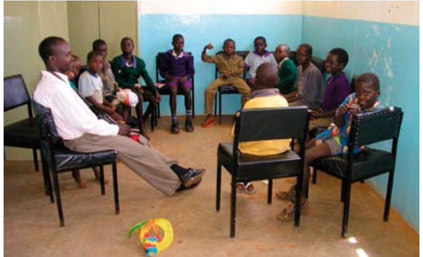
Traumaprogramma in Kimilili