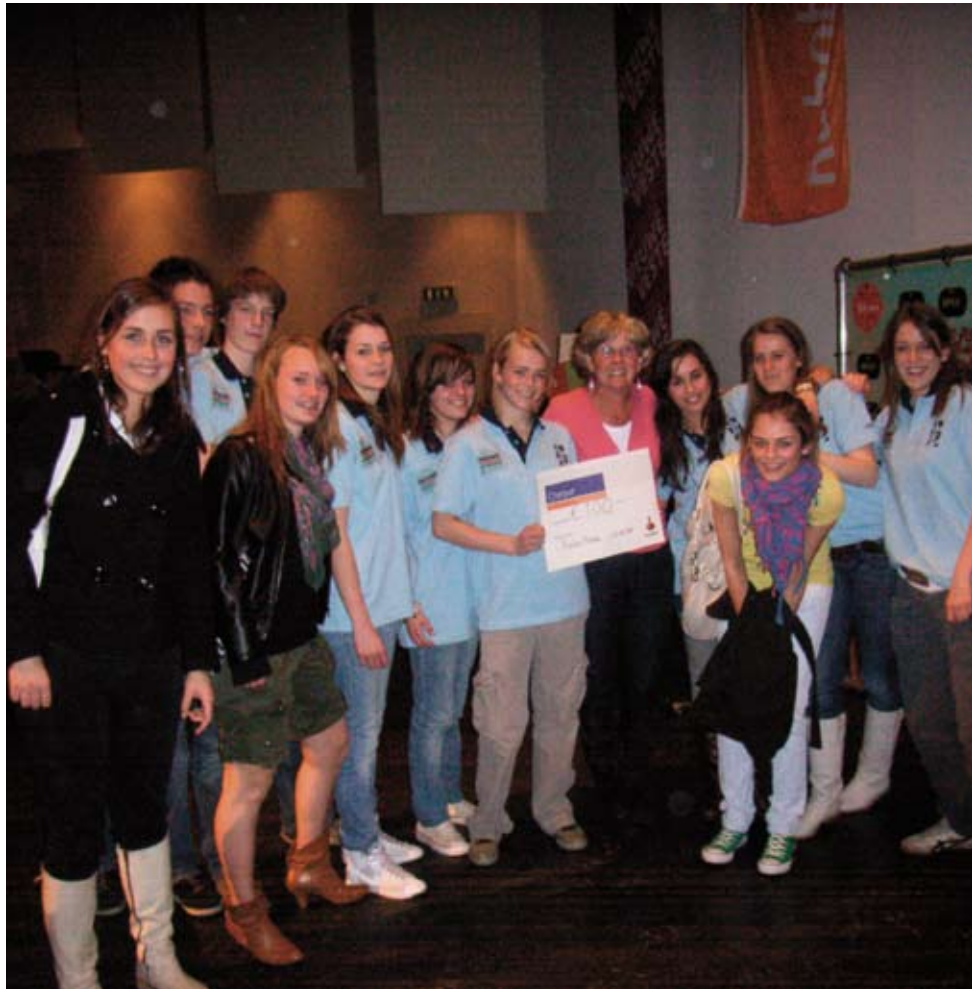
De deelnemers van het OLV