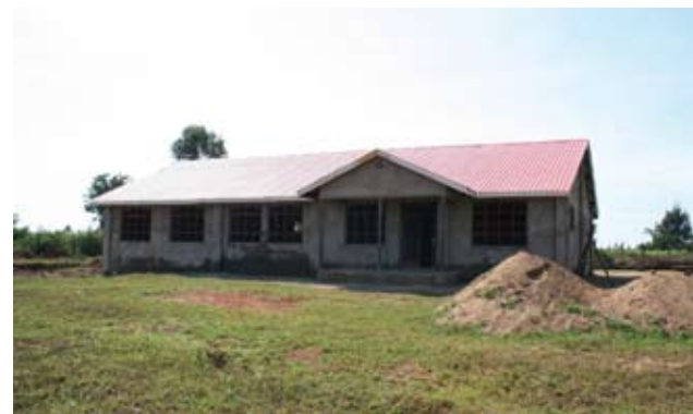
Het EARC voor gehandicapte leerlingen in Mumias is bijna klaar

vanwege deze ontredde en het gevoel "gebeurt dit werkelijk met mij?" en "ik weet niet meer hoe ik in het leven moet staan". Ze waren hun familiebanden kwijt en waren opvliedend, agressief, boos en apathisch.