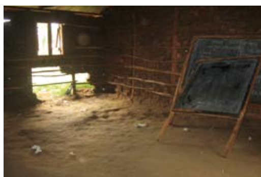
In de klas van Makunga PS

Onze partner IcfEM kwam met het verzoek hier scholen te helpen omdat ze erg weinig faciliteiten hebben en overbevolkt zijn: de scholen hebben allen tussen de 1200 en 1500 leerlingen. 100 kinderen in een lemen klaslokaal zonder boeken of schoolbanken is geen uitzondering maar regel. In maart 2007 hebben wij alle scholen een kort bezoek gebracht, samen met IcfEM. Wij waren erg onder de indruk van wat we tegenkwamen. Na afloop van de bezoeken hebben we besloten te helpen. Aan de scholen hebben we gevraagd een meerjarenplan te maken en aan te geven wat de hoogste prioriteit is om te verbeteren. Voor een beperkt bedrag kan op elke school een project gerealiseerd worden. We zien dit als een eerste project ter aanmoediging om in het kader van "community development" de kwaliteit van deze scholen en het onderwijs in deze regio stapsgewijze te verbeteren.