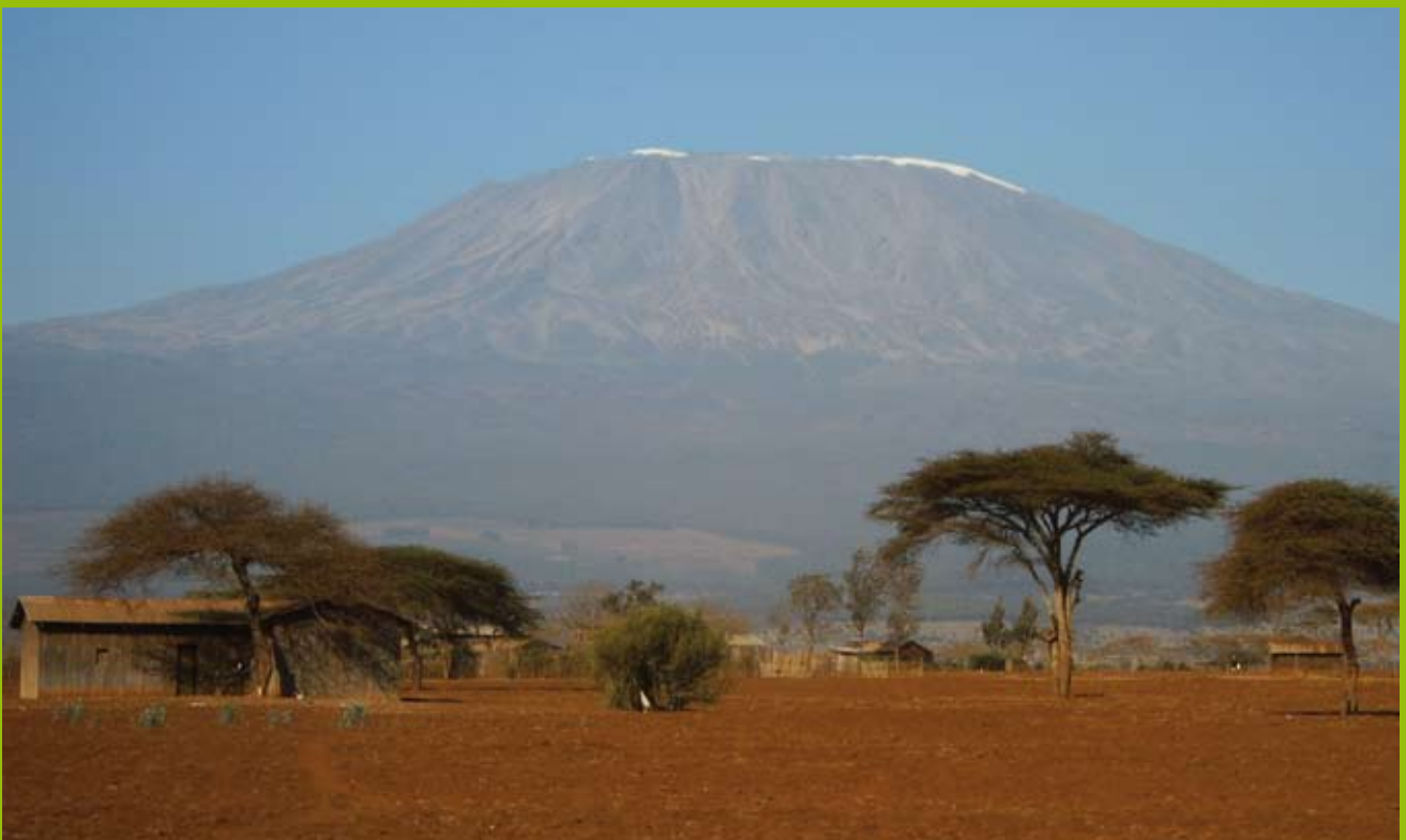
Daar gaan we naartoe: 5896 meter hoog!