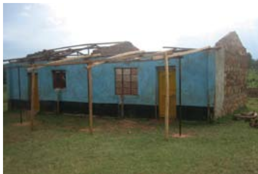
Stormschade bij Luunyu PS

Ten oosten van Kimilili ligt op een half uurtje rijden een aantal lagere scholen in het Tongareni gebied. De scholen liggen verspreid maar toch dicht bijeen in een typisch West-Keniaans landschap: licht heuvelig, groen, veel bomen en mooie uitzichten. Er zijn geen asfaltwegen en de mensen zijn er erg arm, leven in hutjes op kleine stukjes land waar ze veelal maïs verbouwen. Waterleiding en elektriciteit zijn niet aanwezig.