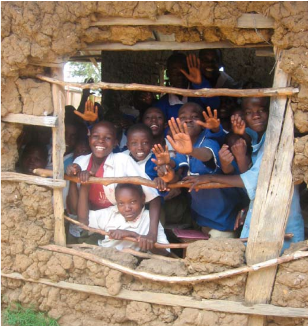
Een van de vele klassen van Luuya PS

Het is geweldig dat zo velen ons financieel steunen waardoor we deze 7 projecten dit jaar kunnen beginnen. Hartelijk dank voor alle bijdragen!