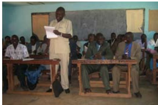
De vergadering in Mukuyuni