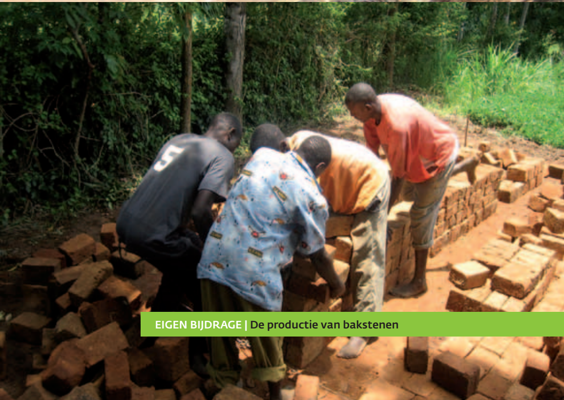
EIGEN BIJDRAGE | De productie van bakstenen