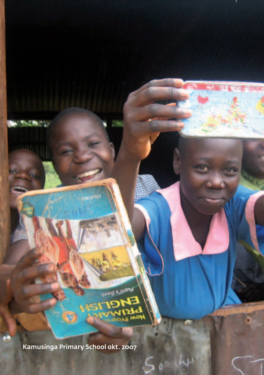
Kamusinga Primary School okt. 2007