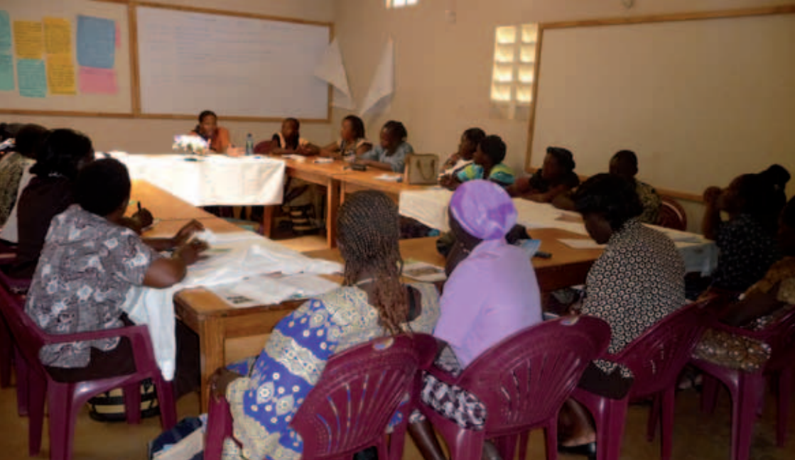
Boven: leerlingen van de technische school | Onder: training voor kleuterleidsters