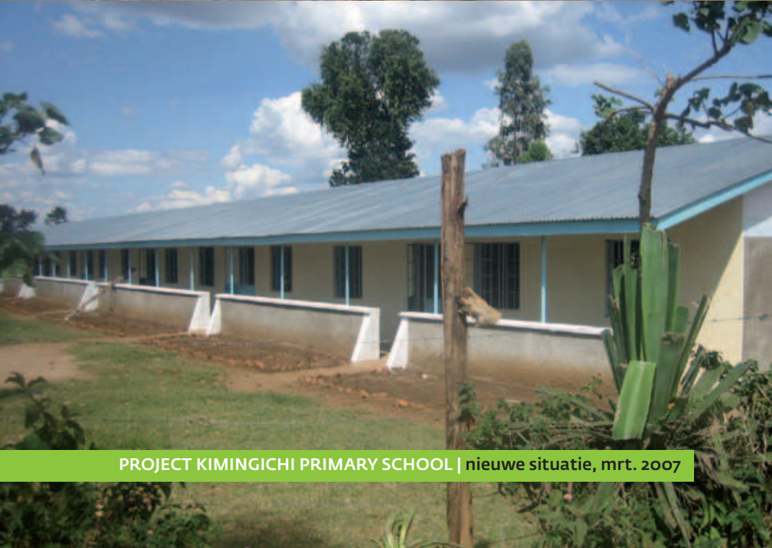
PROJECT KIMINGICHI PRIMARY SCHOOL | nieuwe situatie, mrt. 2007