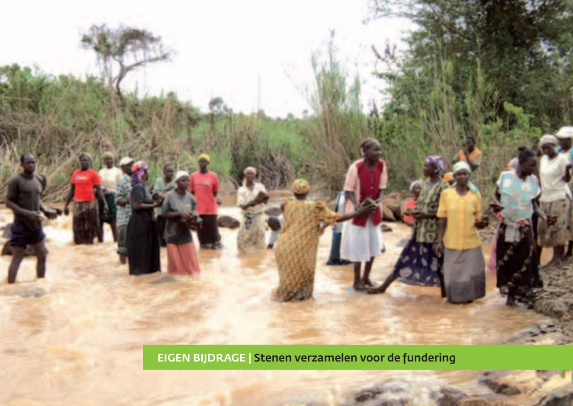
EIGEN BIJDRAGE | Stenen verzamelen voor de fundering