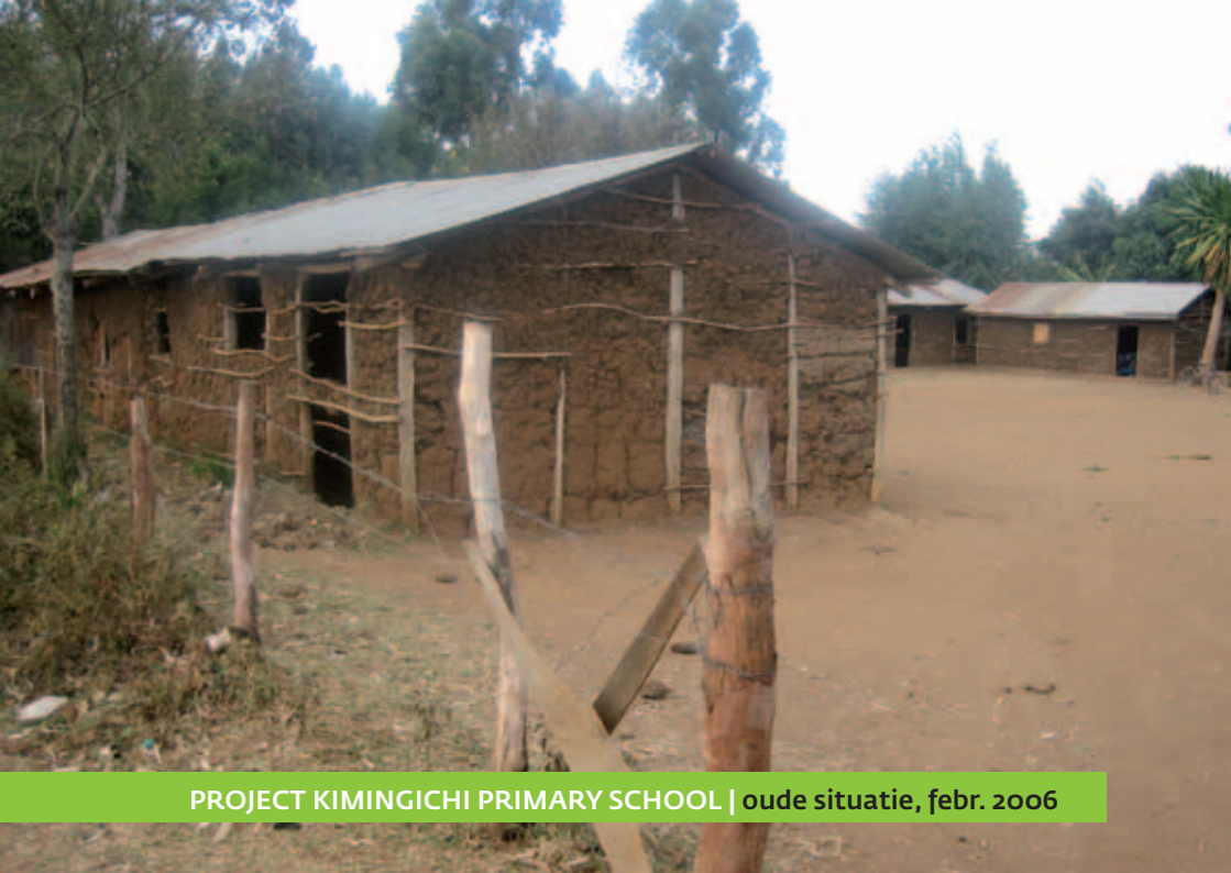
PROJECT KIMINGICHI PRIMARY SCHOOL | oude situatie, febr. 2006